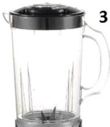
3. Kalich s bočním uchem a víkem