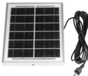
Panel s kabelem